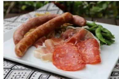
YONA YONA SET イメージ