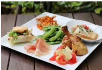
BEER FRIENDLY PLATE イメージ