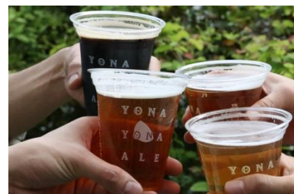
飲み放題イメージ