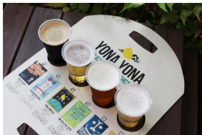
4 種の飲み比べセットイメージ