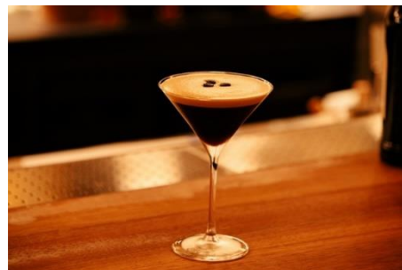
エスプレッソ マティーニ